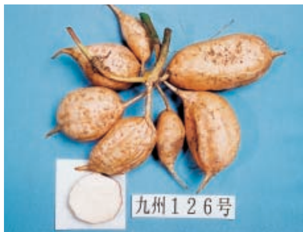
写真2 “コナホマレ”の地下部