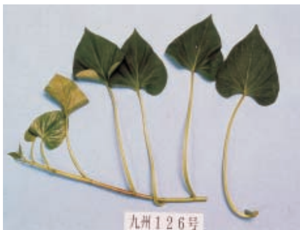
写真1 “コナホマレ”の地上部