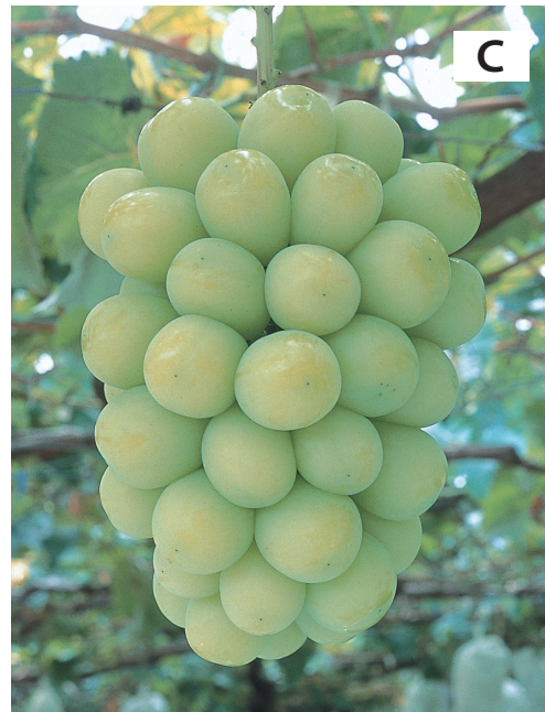
Fig. 2. 'Shine Muscat' grape fruit clusters before harvesting (A), seeded bunch (B) and seedless bunch (C).