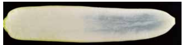
図-1 ダイコン青変症の例 (品種 '福登' の切断面)

従来、ダイコン青変症の発症程度の評価は、20℃程度の温度でダイコンを貯蔵し、5~7 日後に根部を切断して青色の発生を確認していた。池下ら (2011) は貯蔵試験による発症評価で、品種によって発症の程度が異なることなどを明らかにした。しかし貯蔵試験による評価は、再現性にばらつきが大きく、判定までに時間がかかることから、ダイコン青変症の発症機構解明や現場での対策に用いることは困難であった。