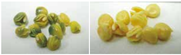
図-4 ダイコン種子を用いた青変症リスク評価法による青色生成程度 過酸化水素(3%)で処理2時間後の様子 左:除皮したダイコン品種‘福誉’,右:同‘耐病総太り’

ないが、HPLCクロマトグラムから、ダイコン根部には4-OHGBが含まれていると推察され、青変症が発症する際には、4-OHGBが酸化されて青色色素になるものと考えられた。ただし、ダイコン種子中や根部のインドールグルコシノレート濃度と青変症の発症程度については現時点では必ずしも明らかではないため、今後、栽培時の環境要因による変動や、種子のロット間差等も含めて検討することが必要と考えられる。