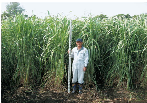
写真1 育成地での「しまのうしえ」の草姿（収穫3回目、2年目1番草）

り短い“中”である。葉幅は「KRf093-1」より広い“やや広”である。葉厚は「KRf093-1」より薄い“やや薄”である。葉身の花青素（アントシアニンにより紫色を帯びる）は“無”であり、「KRf093-1」や「NiF8」と異なる。葉鞘長は「KRf093-1」と同じ“中”である。葉鞘の毛群は“無”で「KRf093-1」より少ない。葉鞘の蠟質物は「KRf093-1」と同じ“少”であり「NiF8」よりも少ない。蔗茎の形態は「KRf093-1」と同じ“円筒型”である。蔗茎の基本色は「KRf093-1」と同じ“黄緑”である。茎長は「KRf093-1」と同じ“長”であり、「NiF8」よりも長い。茎径は「NiF8」の“中”より細く、また「KRf093-1」の“細”より細い“かなり細”である。節間数は「KRf093-1」よりやや少ない“や