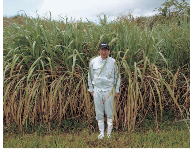
写真3 現地での「しまのうしえ」の草姿（収穫4回目、2年目2番草）

鹿児島県徳之島町において実施した現地試験における耕種概要、収穫調査成績および飼料成分を第10、11および12表に示した。また、徳之島での「しまのうしえ」の草姿を写真3に示した。「しまのうしえ」は「KRF093-1」より株出し栽培での収穫茎数が多かった。「しまのうしえ」の仮茎長は1番草では「KRF093-1」と同程度であったが、冬季を含む期間に生育した2番草では小さかった。茎径は「KRF093-1」と同程度かやや小さかった。蔗汁ブリックスは「KRF093-1」と同程度であった。