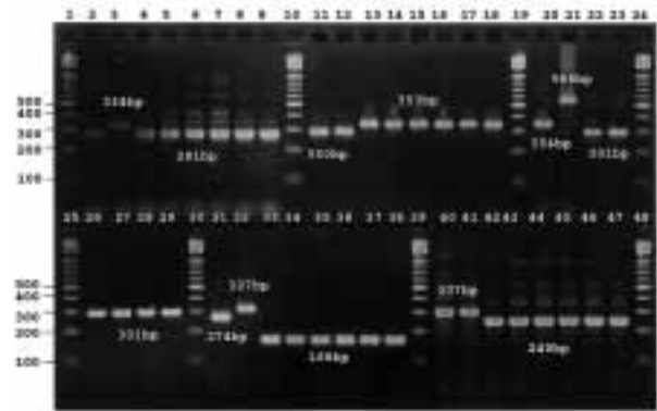
図1 PCR増幅産物のサイズの測定例。PCR反応終了後1 \mu lを2.5%アガロースゲル電気泳動にて解析した。100bpラダーのマーカの泳動像と比較して、PCR増幅産物のサイズを推定した。レーン1, 10, 19, 24, 25, 30, 39, 48:100bpラダーマーカー。レーン2~9, 11~18, 20~23, 26~29, 31~38, 40~47:それぞれプライマーセットMATR-1, MATR-2, MATR-3, MATR-3, MATR-4, MATR-5にてターゲットDNAを増幅した。テンプレートDNAは各プライマーセットにおいてレーン番号の小さいほうから鳥型結核菌参照株A, 同B, 鳥型結核菌野外分離株1, 同2, 同3, 同4, 同5, 鳥型結核菌参照株Cの順である。得られたサイズから換算表(表3)にて縦列反復配列の反復数を求める。さらにこの値から各株のアリルプロファイルを求める(図2)。