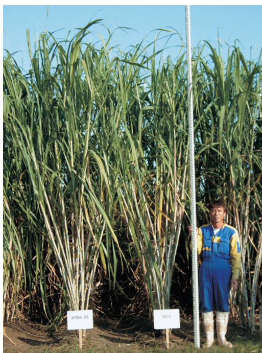
写真1 「Ni27」の草姿 左:「Ni27」, 右:「NiF8」