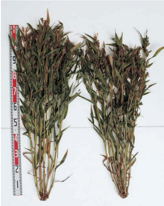
写真1 「とりいずみ」の草姿 (左：とりいずみ、右：あきしずく) 2010年10月九州沖縄農業研究センターで撮影。