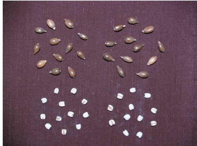
写真2 「とりいずみ」の穀実 (平均粒長9.6mm, 粒幅4.9mm) (左：とりいずみ, 右：あきしずく, それぞれ上は種子, 下は80%仕上げの精白粒)