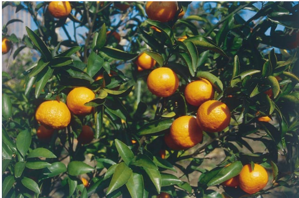
Fig.3. Fruiting shoots of 'Kankitsu Chukanbohon Nou 6 Gou'.