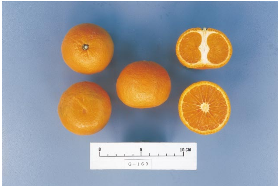
Fig.2. Fruit of 'Kankitsu Chukanbohon Nou 6 Gou'.