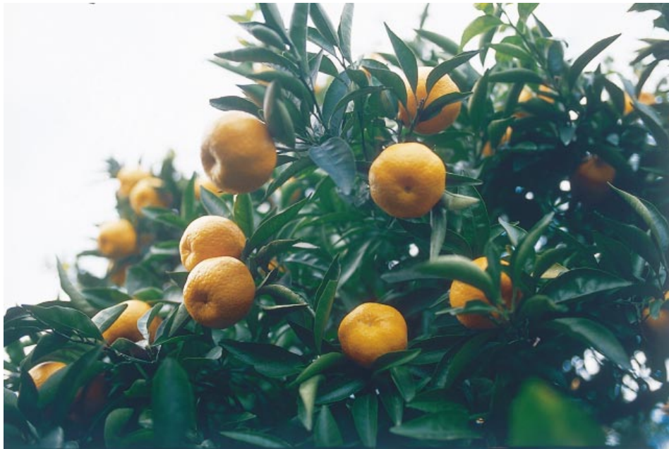
Fig.3. Fruiting shoots of 'Kankitsu Chukanbohon Nou 5 Gou'.