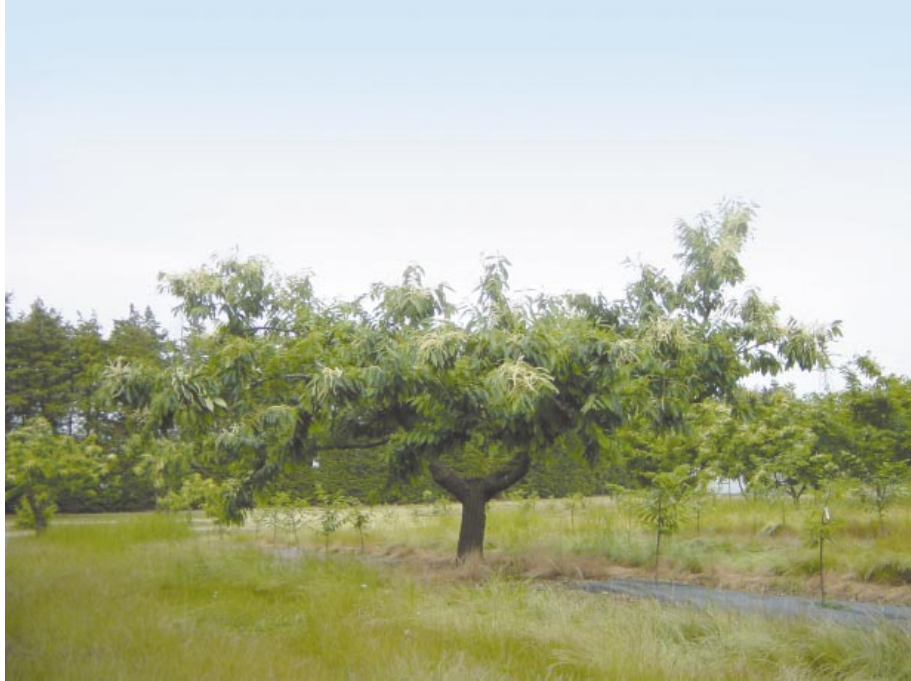
Fig. 2. Tree form of 'Shuuhou'.