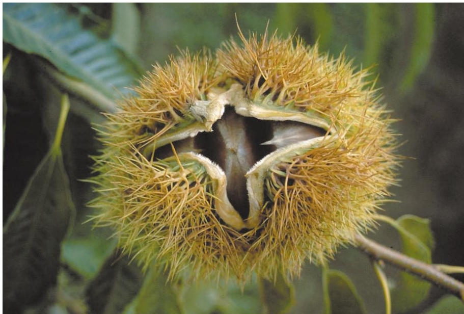
Fig. 3. Bearing shoot of 'Shuuhou'.