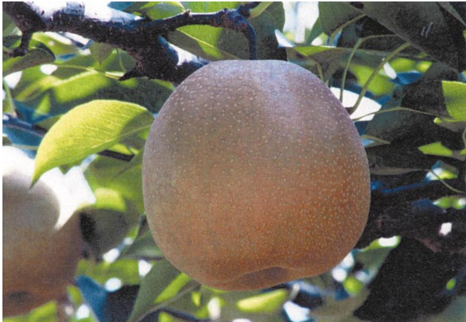
Fig.4. Fruit of 'Oushuu'.