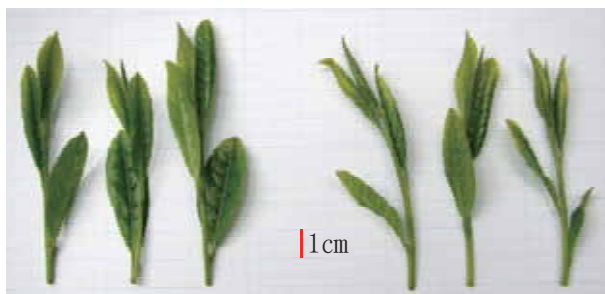
図-5 一番茶摘採期の‘さえあかり’（左）と ‘やぶきた’（右）の新芽 新葉は鹿児島県農業開発総合センター茶業部圃場（南九州市）において、摘採期である2009年4月17日に撮影した。‘やぶきた’は撮影3日後の4月20日に摘採された。

‘さえあかり’の挿し木平均生存率は85.4%，5段階評価における挿し木均整度は3.7，生育の良否は3.8であった（表-7）。定植2年目の活着率，樹高，生育の良否の全国平均値は‘やぶきた’と同等であり，株張りは‘ゆたかみどり’と同等であった。試験最終年度の樹高と株