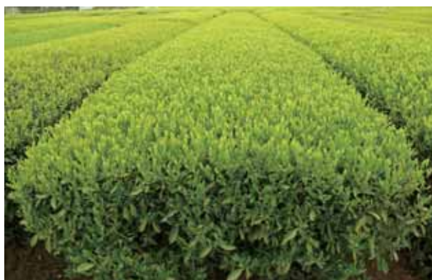
図-3 ‘さえあかり’の一番茶期の園相 2009年4月17日鹿児島県農業開発総合センター茶業部圃場（南九州市）にて撮影。