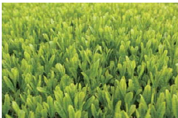
図-4 ‘さえあかり’の一番茶新芽 2009年4月17日鹿児島県農業開発総合センター茶業部圃場（南九州市）にて撮影。