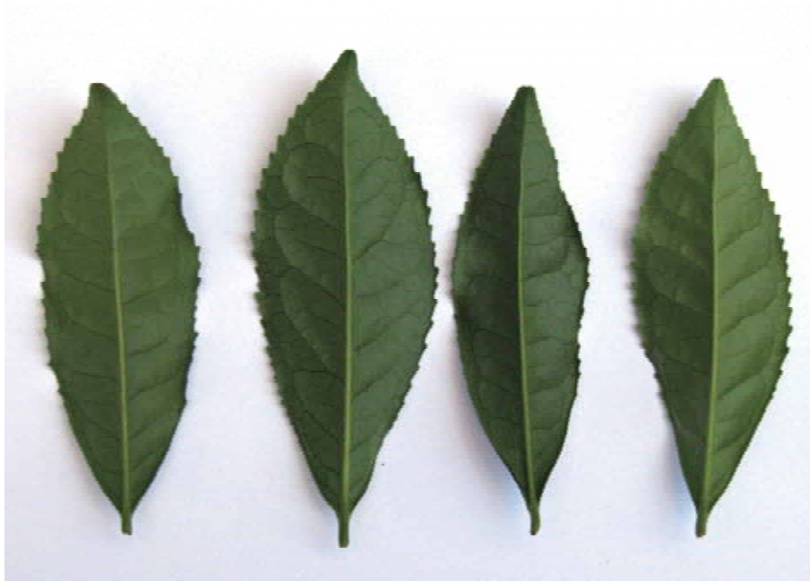
図-6 成葉形態の品種間差異

左から‘やぶきた’，‘Z1’，‘さえみどり’，‘さえあかり’．育成場所の一番茶徒長枝から採集し，2010年6月16日に撮影した．各品種の葉長は10cm程度．