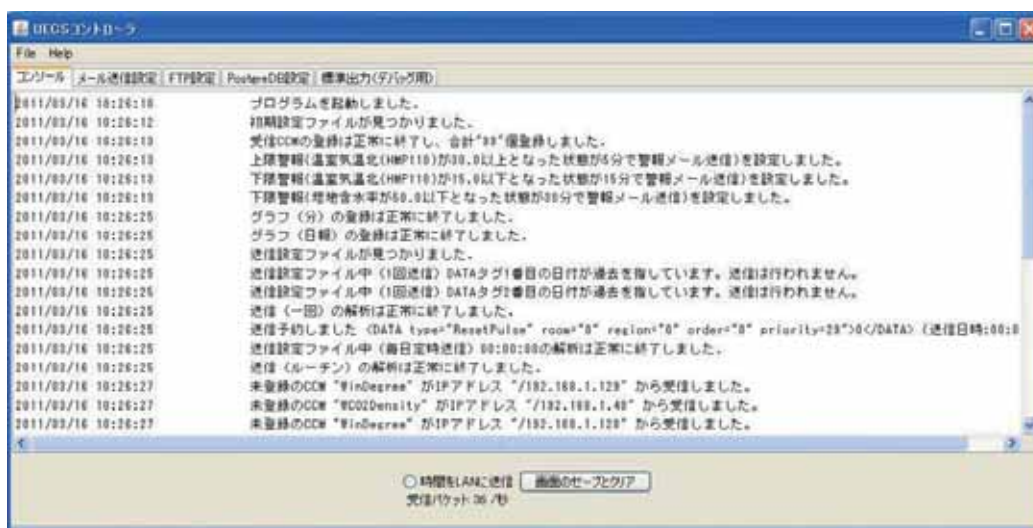
図-3 管理ソフトウェア起動時の様子

ソフトウェア起動すると5つのタブ画面を持つ起動画面が現れる。コンソール画面ではソフトウェアの動作状況を表示。メール送信設定、FTP設定、PostgreSQL設定画面はそれぞれ、外部へのデータ送信に利用するアカウントなどの設定を行う。標準出力は、デバッグ用の画面であり、管理ソフトウェアで解析できない異常が発生した時に原因を解析するために利用する。