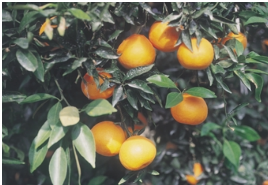
Fig. 2. Fruiting branch of 'Nishinokaori'.