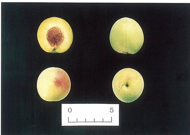
Fig. 2. Tree shape (A), fruiting branch (B) and fruit (C) of 'Kagajizou'.