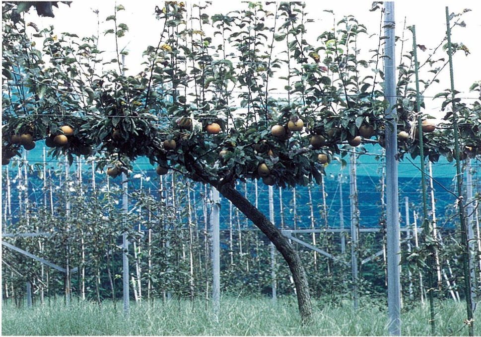
Fig. 2. Tree shape of 'Akizuki'.