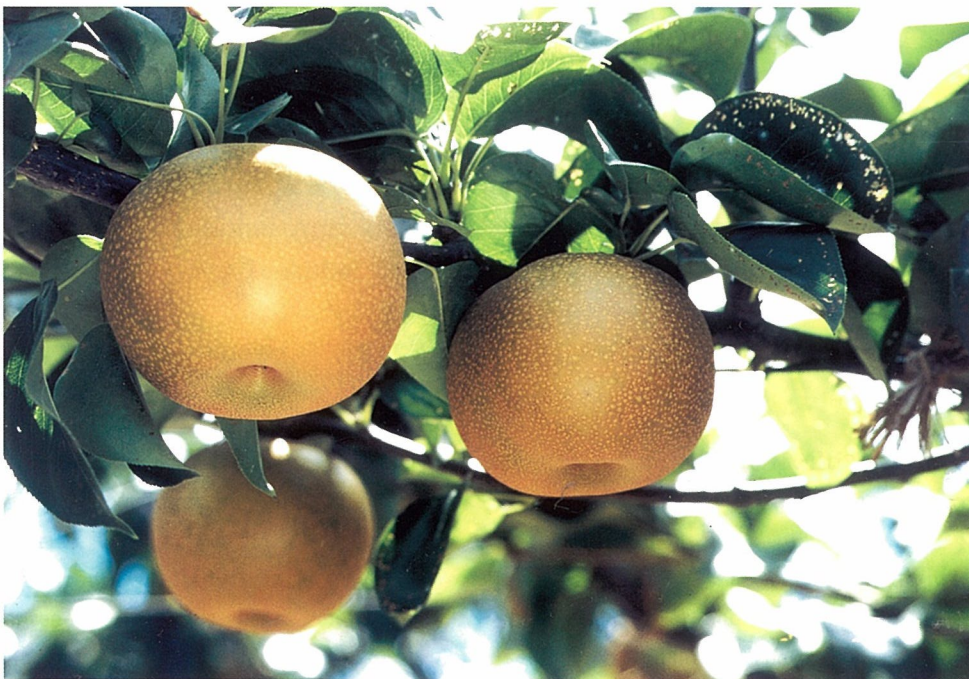
Fig. 3. Fruiting branch of 'Akizuki'.