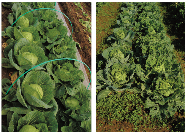
第3図 キャベツの処理区と対照区での雑草の発生と虫害の状況