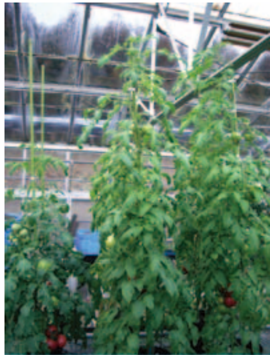
とまと中間母本農11号 桃太郎8 瑞栄

‘とまと中間母本農11号’の有する短節間性を夏秋栽培および促成栽培で調査し、作業省力性を夏秋栽培で調査した(表-1)。対照品種として‘桃太郎8’および‘瑞栄’ (株式会社サカタのタネ)を用い、2004年の夏秋栽培