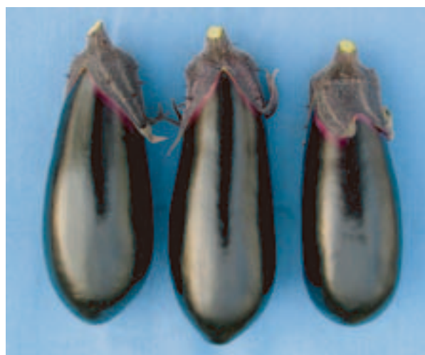
図-3 ‘あのみり’の未熟果 2006年6月1日, 野菜茶業研究所(安濃)内圃場