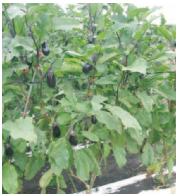
図-2 ‘あのみり’の植物体 2004年9月6日撮影, 野菜茶業研究所(安濃)内圃場