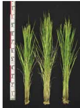
(左：越のかおり 中：コシヒカリ 右：キヌヒカリ)

よりやや少ない“中”，草型は“偏穂重型”である(写真1)。稈長，穂長，穂数，草型のいずれも「キヌヒカリ」とほぼ同じである。