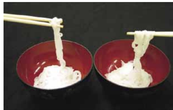
写真 3 「越のかおり」の麺

米粉 70%，つなぎとなるタピオカデンプン 30%で製麺適性を検討した結果，「コシヒカリ」，「春陽」は麺に適さず，「越のかおり」は「ゆきひかり」の麺と同等に，麺離れの良い（麺同士の付着が少ない）麺ができることがわかった（表 14，写真 3）。澱粉の老化の程度が茹で麺の物性に最も重要な指標であることが明らかにされていることから (7) ，アミロース含有率が高く（表 10），RVA によるコンシステンシーが大きい（表 13）特性を有する「越のかおり」は，