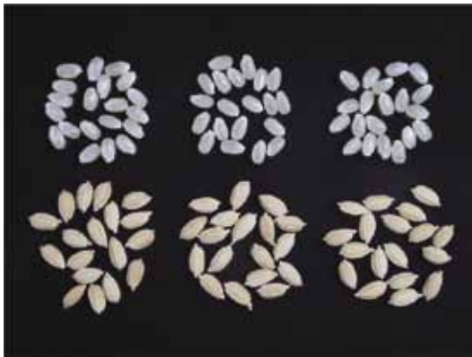
写真2 「越のかおり」の籾および玄米 (左：越のかおり、中：コシヒカリ、右：キヌヒカリ)

カリ」より短く、適搗精時における搗精歩合は、「コシヒカリ」とほぼ同等で、胚芽残存率は「コシヒカリ」よりやや少なく、玄米白度、白米白度ともに、「コシヒカリ」よりやや高い。「コシヒカリ」より、やや碎米の発生は少なく、「夢十色」より明らかに少ない。