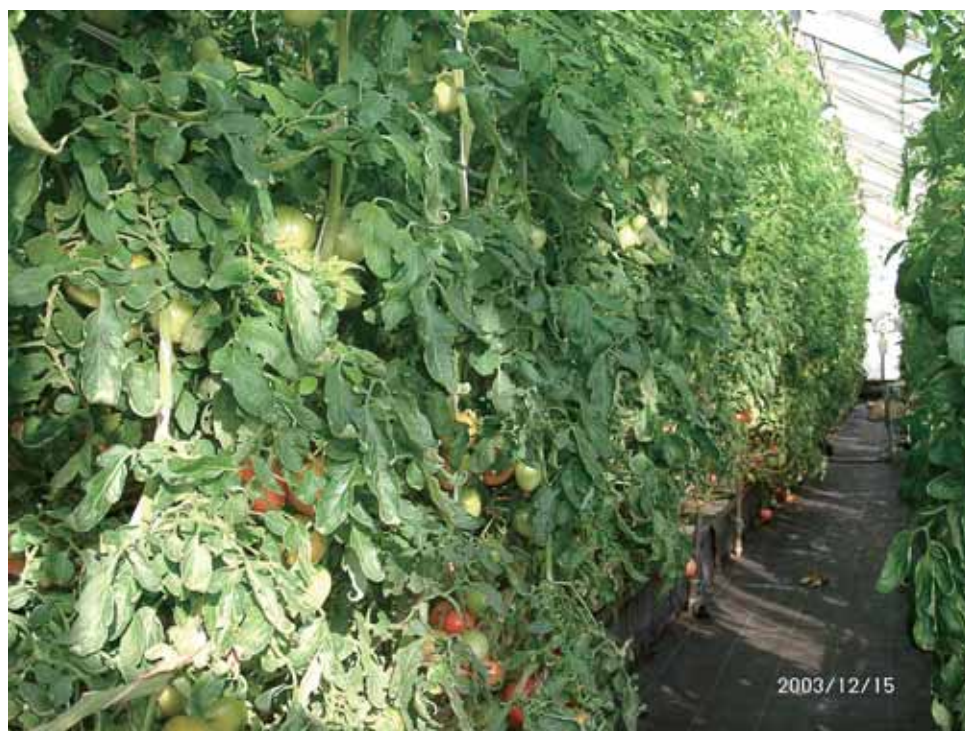
Fig. 2-2 Tomatoes cultivated in solutions that had no remaining manure elements N, P and K in the culture solution (N : P : K, 10 : 1.2 : 11 and Plant height 3.0m, LAI 3.3, 2003/12/15).