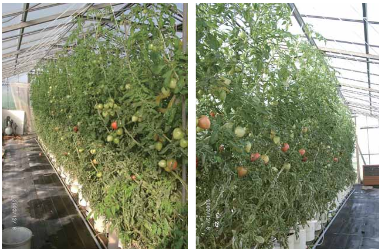
Fig. 3 Tomatoes cultured by the method of daily quantitative regulation of NPK and the culture solution in which the concentration of Mg was 20 ppm (left) or 40 ppm (right), and in which the EC was changed by using a \text{CaCl}_2 solution from 1 to 10 \text{dS}\cdot\text{m}^{-1} (2003/12/8)

窒素供給源の \text{NH}_4\text{NO}_3 の一部を \text{NaNO}_3 あるいは \text{HNO}_3 に変えて対応する。肥料要素の残留を抑制し、pH 制御に伴う酸およびアルカリの培養液への投入を抑制した本栽培法は、個体当たり培養液量 8ℓ を用いると培養液の交換なく 1 年間栽培可能である。