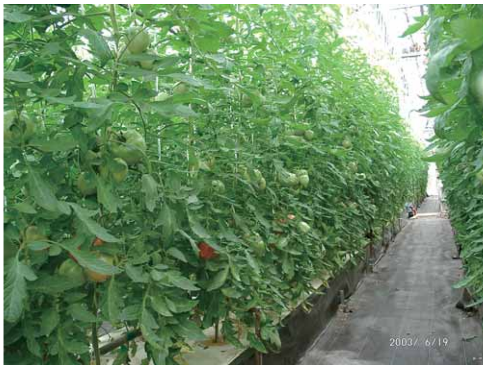
Fig. 2-1 Tomatoes cultivated in solutions that had no remaining manure elements N, P and K in the culture solution (N : P : K, 10 : 1 : 10 and Plant height 2.5m, LAI 2.7, 2003/6/19).