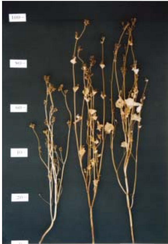
写真1 「とよむすめ」の草姿 (左:「信濃1号」、中:「とよむすめ」、右「葛生在来」) 撮影年月日:2002年2月22日 撮影場所:中央農業総合研究センター 北陸研究センター