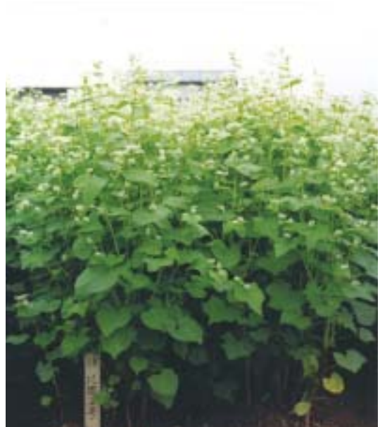
写真3 開花最盛期における「とよむすめ」の草姿 撮影年月日:2000年10月1日 撮影場所:中央農業総合研究センター 北陸研究センター