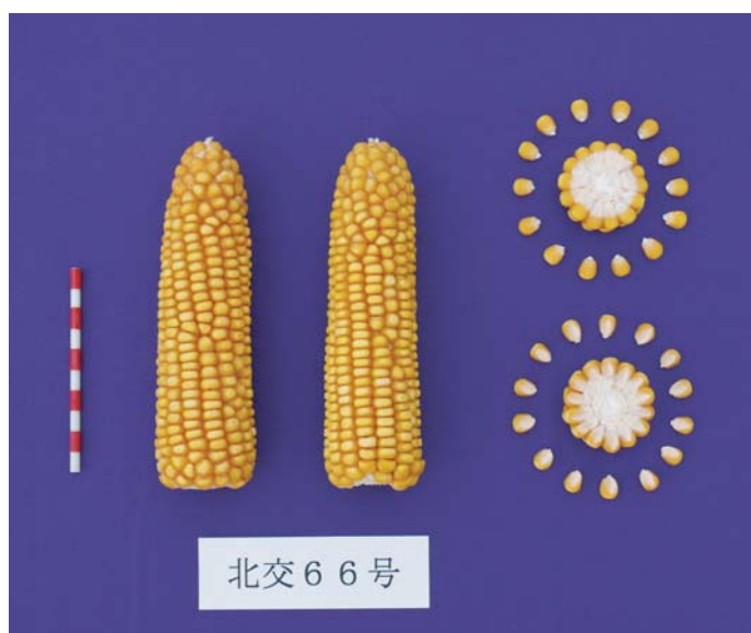
写真 2 「たちぴりか」の雌穂および粒