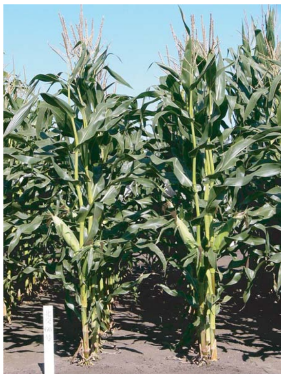
写真 1 「たちぴりか」の草姿