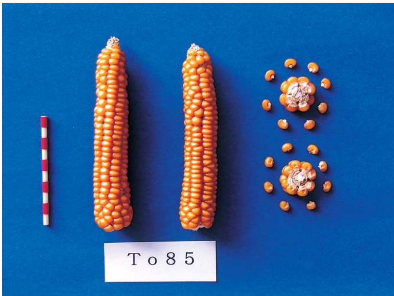
写真2 「To85」の雌穂および粒 (2004年12月24日撮影)