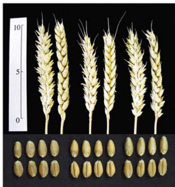
キタノカオリ ホクシン ホロシリコムギ