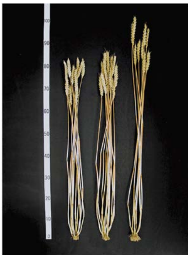
キタノカオリ ホクシン ホロシリコムギ

柳沢朗, 谷藤健, 荒木和哉, 天野洋一, 前野眞司, 田引正, 佐々木宏, 尾関幸男, 牧田道夫, 土屋俊雄 (2000) : 秋まき小麦新品種「ホクシン」の育成について. 北海道立農試集報, 79, 1-12.