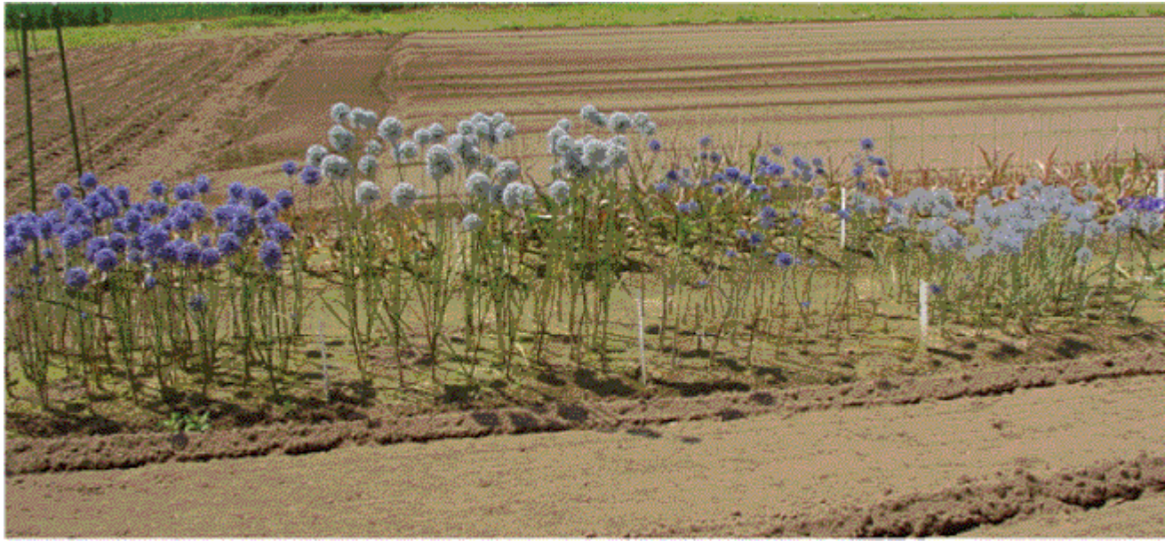
左から：札幌1号、札幌2号、カエルレウム、カエシウム 写真7 露地圃場での草姿の比較