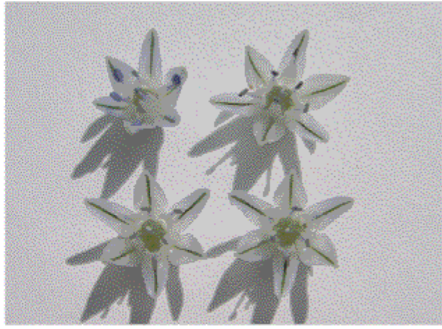
B : アリウム札幌2号