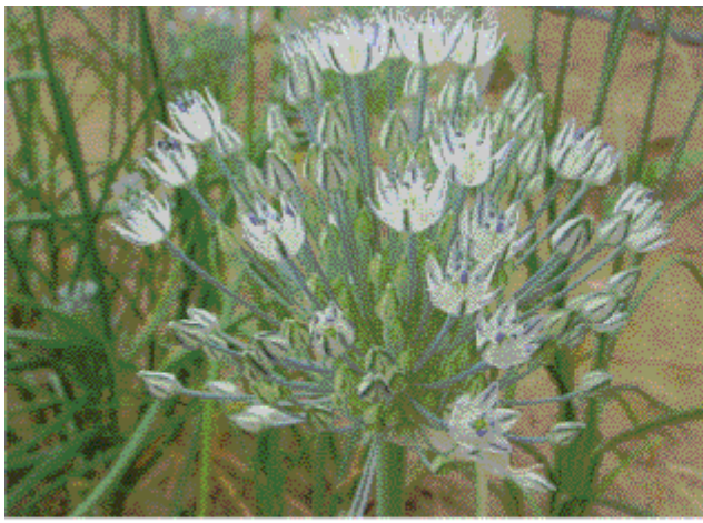
A : 開花初期