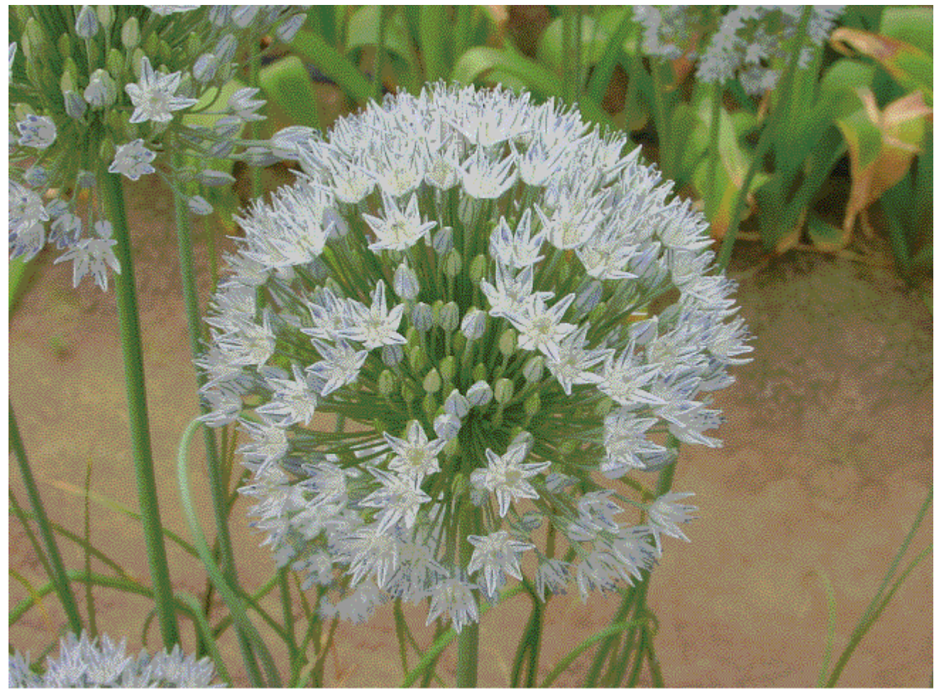
写真4 アリウム札幌2号