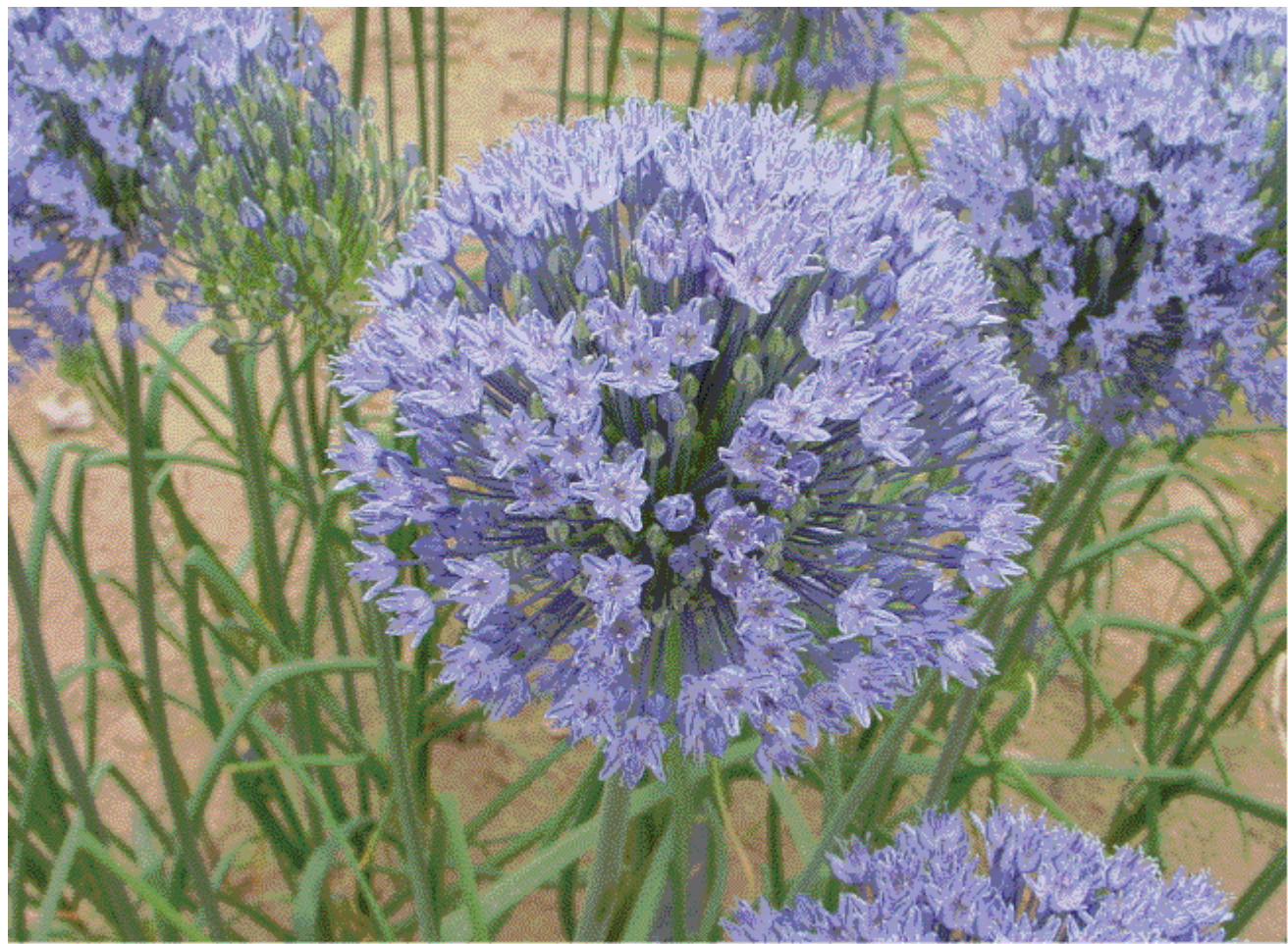
写真3 アリウム札幌1号