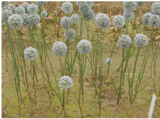
B : アリウム札幌2号