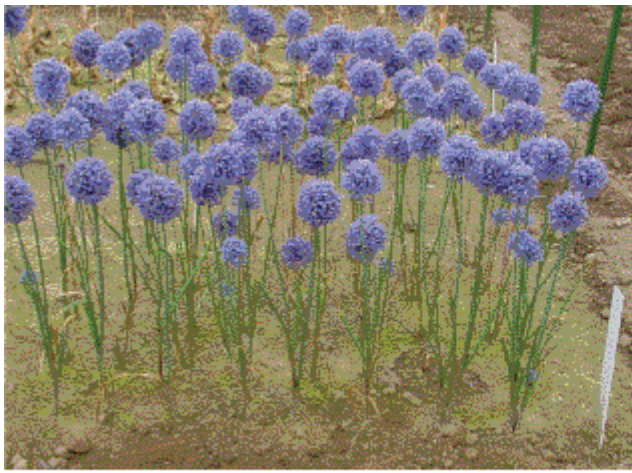
A : アリウム札幌1号