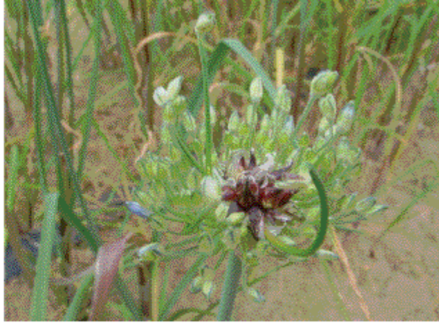
B : 珠芽と第2次花序