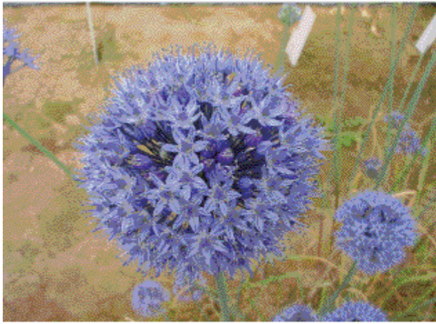
A : 開花中期