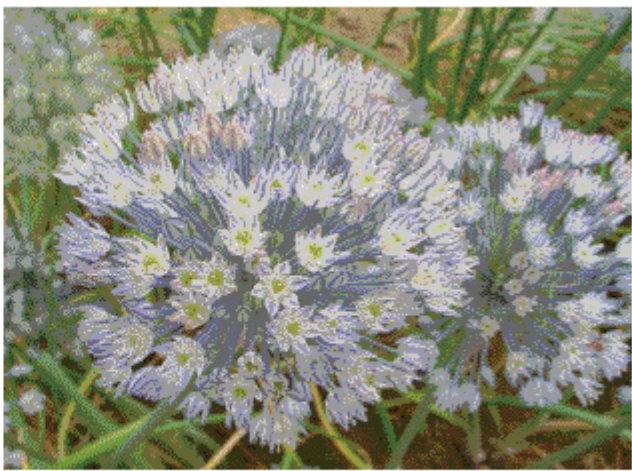
B : 開花中期