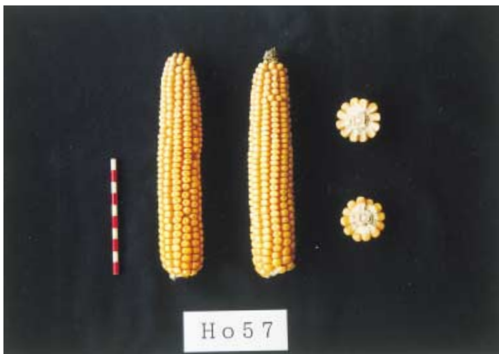
写真2 「H o 57」の雌穂および粒 (2001年1月18日撮影)