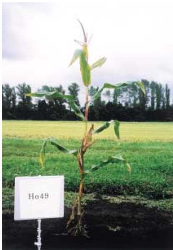
写真1 「Ho49」の草姿 (2000年9月9日撮影)