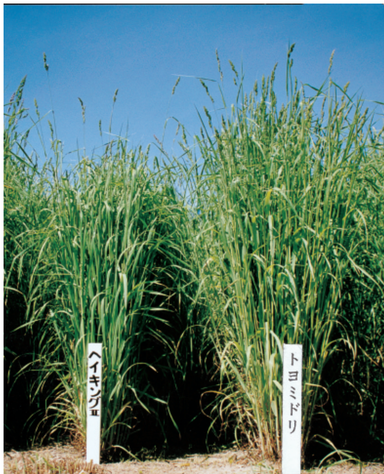
Plate 'Toyomidori' Orchardgrass at heading stage