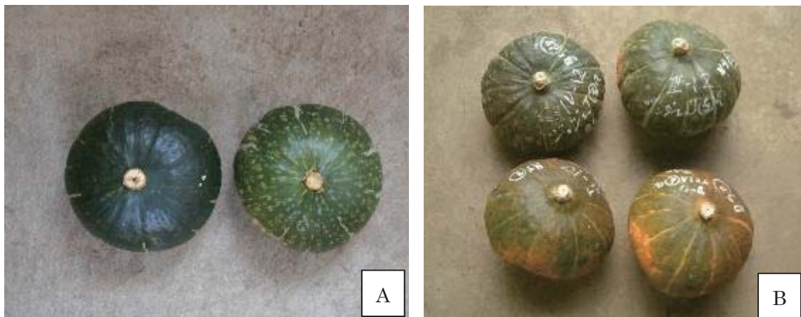
第4図 貯蔵後のカボチャ果皮の褪色