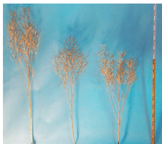
「キザキノナタネ」「ななしきぶ」「ななはるか」

「ななはるか」の葉の緑色の濃淡はやや淡で「ななしきぶ」より淡く、白粉の有無は有、小葉の有無は有、花卉の主な色は黄である(表2)。草丈は低