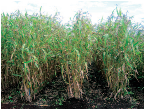
写真3 収穫期の「はときらら」