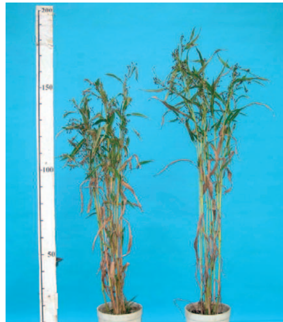
「はときらら」 「はとじろう」

本品種の育成にあたり、優良品種選定試験などを実施し、地域適応性及び諸特性の調査に当たられた北海道檜山農業改良普及センター、上ノ国町農業指導センター、みやぎ登米農業協同組合及び古川農業試験場、岐阜県中山間農業研究所、氷見市農業協同組合、斐川町農業共同組合、鳥取県農業試験場、九州沖縄農業研究センターの担当者各位に謝意を表す