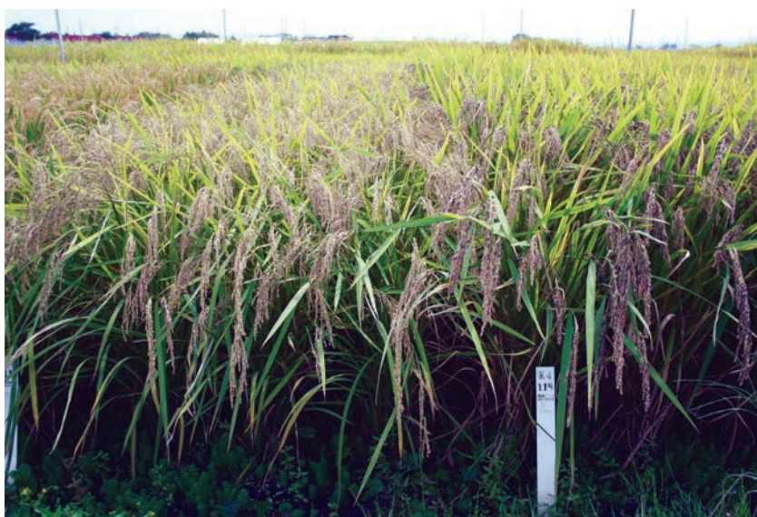
写真2 圃場での草姿（育成地、2007年9月） （ラベルより左：「紫こぼし」、右：「朝紫」）