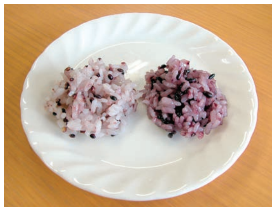
写真4 着色米飯（玄米10%を一般白米に混ぜて炊飯） （左：「紫こぼし」、右：「朝紫」）

注. サタケ家庭用精米機（SKM-5）による。20秒間隔で4～5通りの時間搗精し、白度および胚芽残存歩合の変化が緩慢になった時点を適搗精時間とした。搗精歩合、白度、胚芽残存歩合、碎米歩合は適搗精時の値。1回あたり粒厚1.8mm以上の玄米各340gを供試。「紫こぼし」は1.6mm以上の玄米を使用。白度の測定はKettC-300を使用。胚芽残存は各300粒、碎米歩合は各10gについて調査。