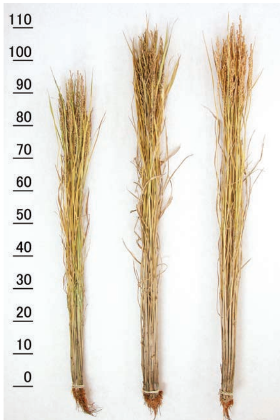
写真1 株標本（左から、「紫こぼし」、「朝紫」、「ヒメノモチ」）

草型は“穂数型”である。一穂粒数、一株穂数ともに多く、「朝紫」及び「つぶゆき」と比較して総粒数が極めて多い。また、二次枝梗着生粒割合が55%と高く（表3）、粒着は「朝紫」と同じ“やや密”である（表1）。芒は無く、ふ先色は“紫”、穎色は“黄白”である。脱粒性は“難”で、成熟期の止葉はほぼ水平である（表1、写真2）。幼苗期から成熟期にかけて「朝紫」と同様に、葉縁、ふ先色に加え、葉舌、葉鞘、節も紫色を呈し、品種識別が容易である。