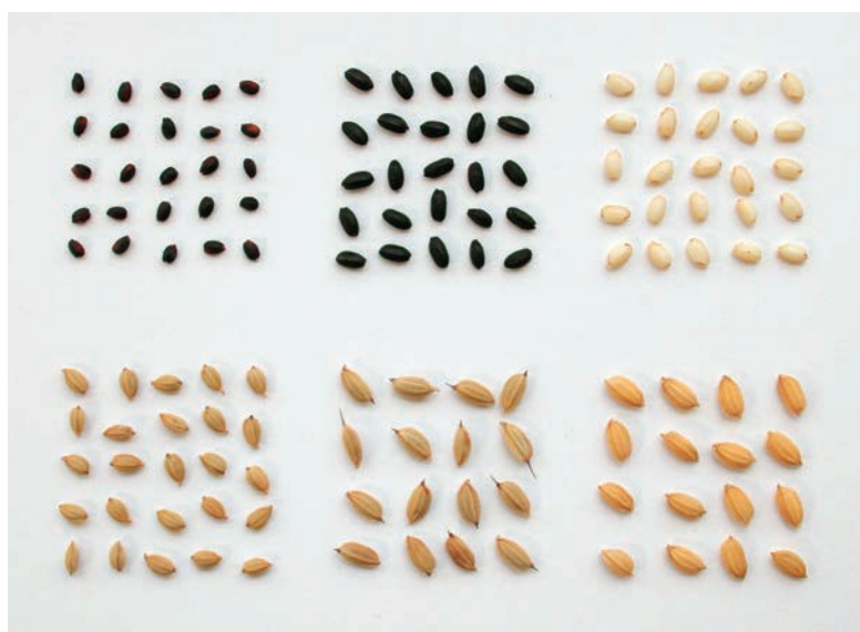
写真3 穂及び玄米（左から「紫こぼし」, 「朝紫」, 「ヒメノモチ」）

注. 青森藤坂：青森県農林総合研究センター藤坂稲作研究部、岩手：岩手県農業研究センター、古川：宮城県古川農業試験場、福島冷害：福島県農業試験場冷害試験地（廃止）。 福島冷害は冷水掛け流し、他は恒温深水法による穂ばらみ耐冷性の検定。 育成地の5年平均は2003～2007年の平均、青森藤坂の2年平均は2006、2007年の平均、古川の3年平均は2003、2006、2007年の平均、福島冷害の2年平均は2003、2004年の平均。