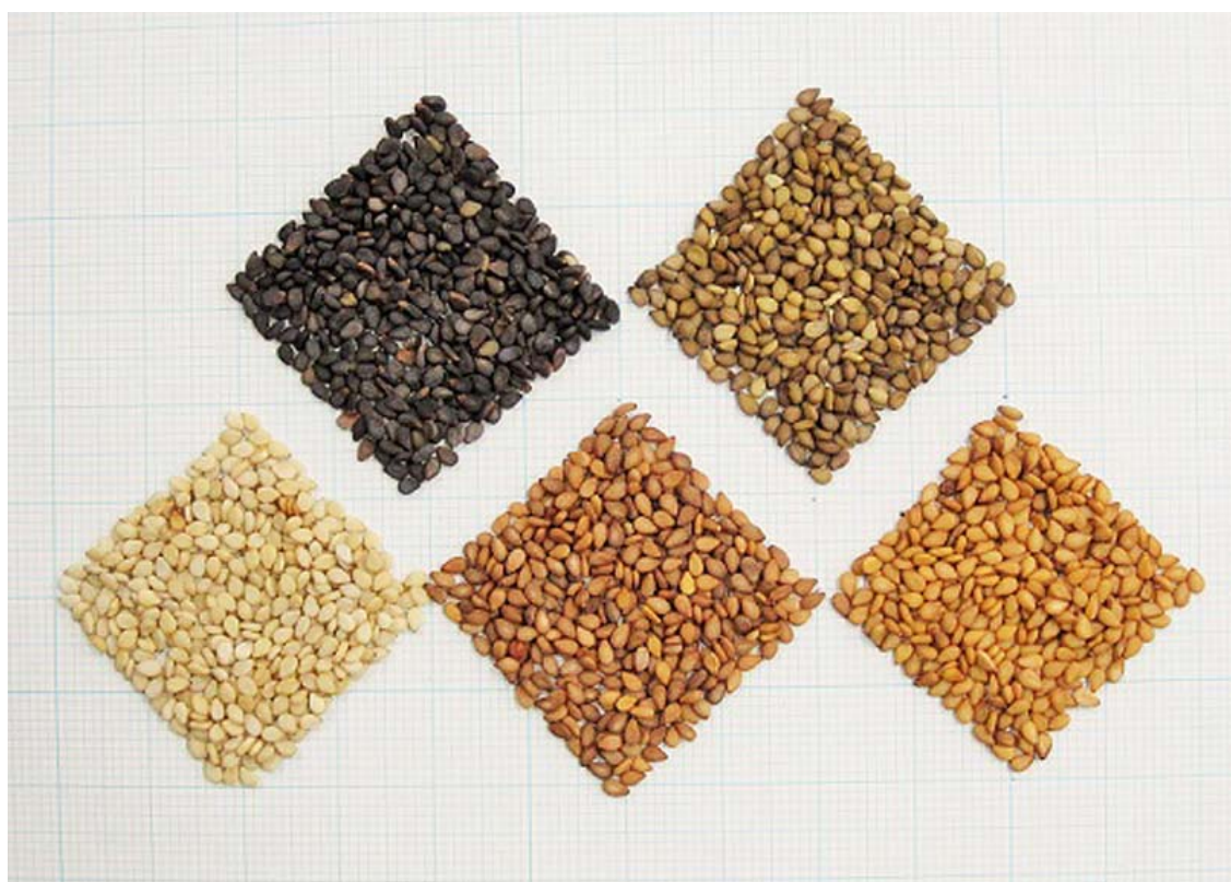
写真3 「まるえもん」(左上)、「ごまぞう」(右上) 「まるひめ」(左下)、「にしきまる」(中下)、「真瀬金」(右下)の子実外観