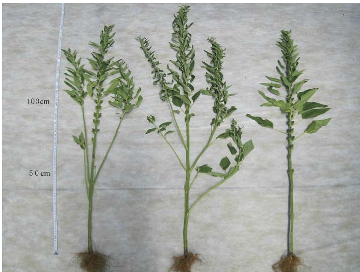
写真2 「にしきまる」(左)と「ごまぞう」(中)と「真瀬金」(右)の個体全図 (2014年9月2日撮影、つくば市観音台圃場)