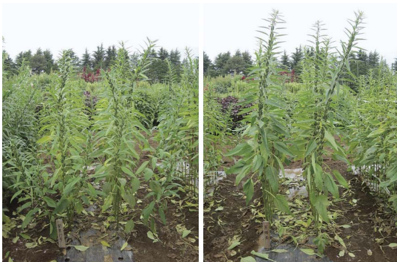
写真1 「にしきまる」(左)と「真瀬金」(右)の立毛草姿 (2014年9月3日撮影、つくば市観音台圃場)