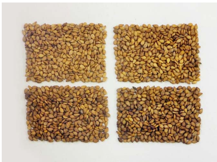
写真4 播種期を異にする「にしきまる」の種皮色 播種期は、2013年6月3日（左上）、2013年6月28日（左下）、 2014年6月4日（右上）、2014年7月3日（右下） いずれも作物研究所谷和原試験圃場産