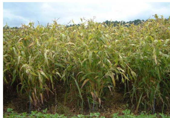
写真3 収穫期の「はとゆたか」 (育成地 水田移植栽培)

注. 特性調査成績は、はとむぎ特性調査基準(案)による。原則として育成地(標準栽培)での観察・調査による。