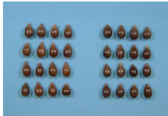
写真2 「はとゆたか」の穀実