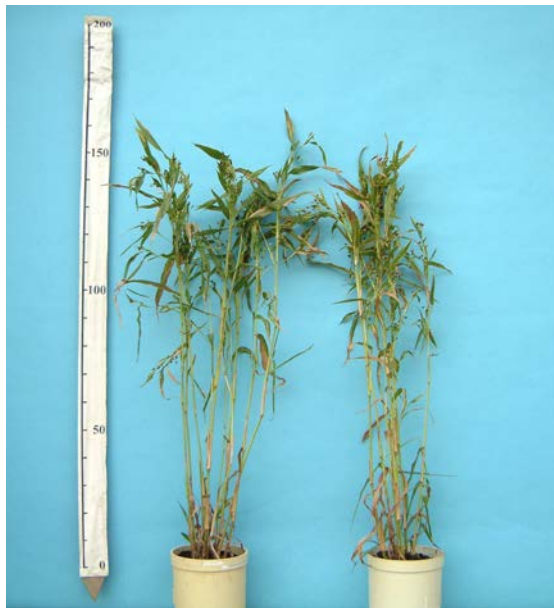
写真1 「はとゆたか」の草姿