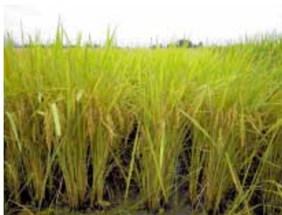
写真4 直播栽培 (打ち込み点播) での「べこあおば」の草姿 (育成地 2004年)