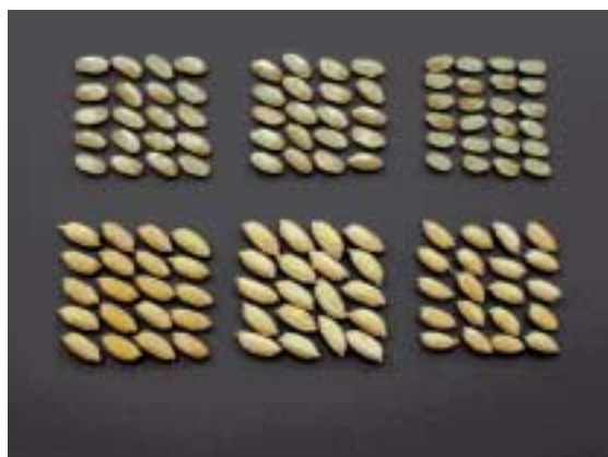
写真2 「べこあおば」の籾及び玄米 (左: べこあおば, 中央: クサユタカ, 右: ふくひびき)