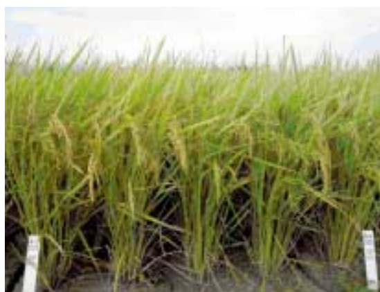
写真3 移植栽培での「べこあおば」の草姿 (育成地2004年)