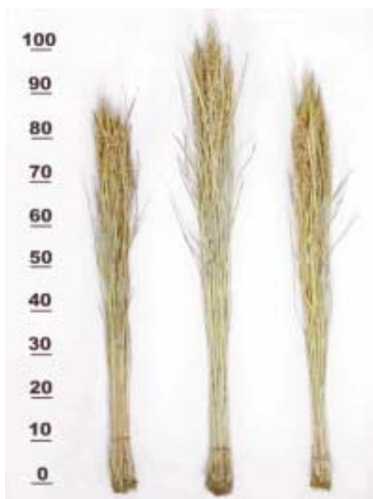
写真1 「べこあおば」の株標本 (左: べこあおば, 中央: クサユタカ, 右: ふくひびき)