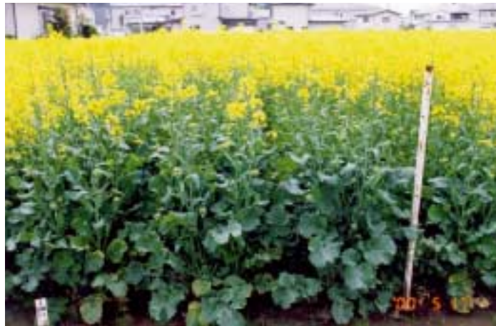
写真3 開花盛期の「菜々みどり」(育成地)