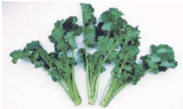
写真4 「菜々みどり」の草姿(なばな用)