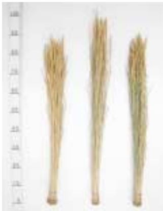
写真1 株標本(左から,「恋あずさ」, 「あきたこまち」, 「めばえもち」)

注) 数値は育成地の1995, 1998, 2003, 2004年の4年平均。*は1998, 2003, 2004年の3年平均。「めばえもち」は2004年の測定及び観察結果。倒伏:0(倒伏無)~5(完全倒伏), 穂いもち:0(発病無)~5(発病極多)。耕種概要:播種日, 移植日の順に1995年は4月13日, 5月25日, 1998年は4月15日, 5月28日, 2003年は4月24日, 5月22日, 2004年は4月15日, 5月20日。施肥量は1995年が基肥N成分0.6kg/a, 追肥N成分0.2kg/a, 1998年が0.7kg/a, 0.3kg/a, 2003年と2004年が0.7kg/a, 0.2kg/a。栽植密度は, 33.3cm×15.0cm(行間×株間)で3本植。その他は慣行栽培に準ずる。