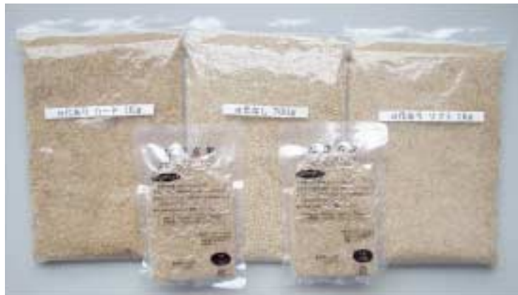
写真 4 「恋あずさ」の発芽玄米試作品

注) ○印はその年次における月の始まり，または終わりを表す。 作物研：作物研究所，近中四農研：近畿中国四国農業研究センター，北農研：北海道農業研究センター，国際農研：国際農林水産業研究センター沖縄支所，花巻農改：岩手県花巻農業改良普及センター