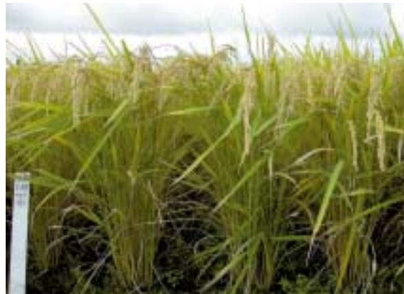
写真2 「恋あずさ」の草姿(秋田県大仙市, 2004年9月)