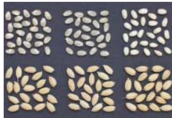
写真3 粉及び玄米(左から、「恋あずさ」、「あきたこまち」、「めばえもち」)

注) 発芽程度は、1(極難)~9(極易)。発芽程度は、育成地における1996, 1998年, 2003年, 2004年の4年平均。「あきたこまち」、「ササニシキ」は、1998, 2003, 2004年の3年平均。