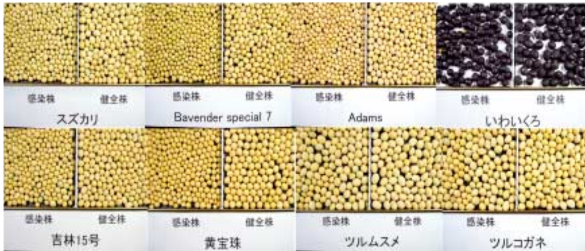
図4 ダイズわい化病抵抗性遺伝資源候補品種の粒径に及ぼすダイズわい化ウイルス YP 系統感染の影響

横軸は粒度、縦軸は各篩の上に残った粒数の全粒数に占める割合を表す。 粒度は、(大粒) > 7.9 mm > (中粒) > 7.3 mm > (小粒) > 5.5 mm > (極小粒) > 4.9 mm