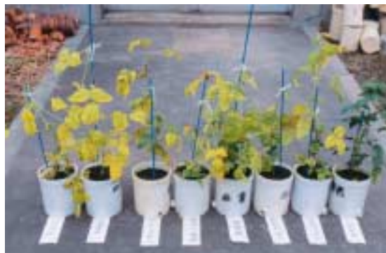
図 1 ダイズわい化病抵抗性遺伝資源候補のダイズわい化ウイルス YP 型感染による黄化症状

株当たりの種子重では、2000 年の試験では、「スズカリ」で対健全株比で 40% 程度であった。供試遺伝資源の反応では、「いわいくろ」では、80% 程度となったが、個体間のばらつきが大きかった (図 2 A)。「Adams」、「黄宝珠」、「ツルムスメ」、「ツルコガネ」では、健全株の 60% 以上が確保された。一方、「吉林 15 号」では、対照の「スズカリ」と同程度の対健全株比 40% 程度を示し減収程度が大きかった。2001 年の試験では、「スズカリ」で健全株の 60% 程度が得られた。供試遺伝資源では、「ツル