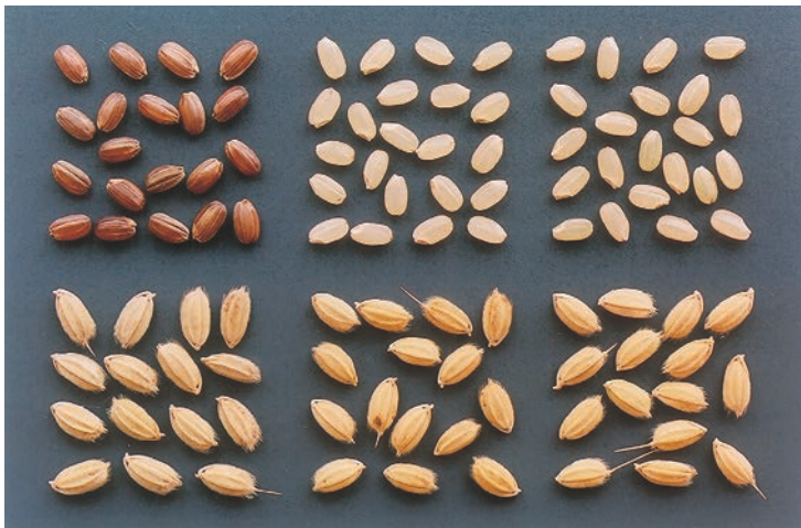
写真2 「紅衣」の籾及び玄米 (左から、紅衣、アキヒカリ、あきたこまち)