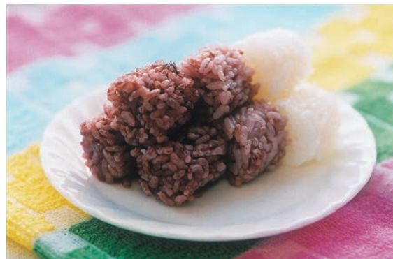
写真4 「紅衣」のおにぎり▶ (左から、紅衣(5分搗精), 紅衣(5分搗精) 50% + シルキーパール50%, あきたこまち)