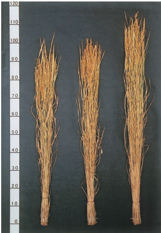
写真1 「紅衣」の草姿 (左から、紅衣、アキヒカリ、あきたこまち)