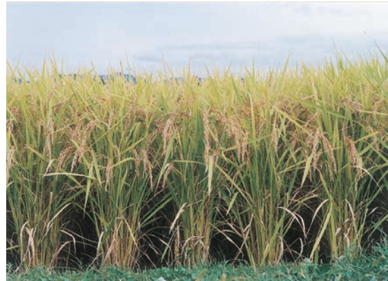
写真3 「紅衣」の圃場における草姿 (育成地, 2001年)