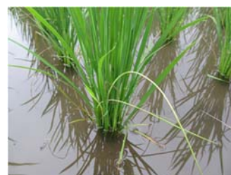
図3 イネ縞葉枯病の典型的な症状