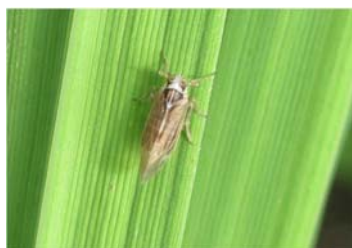
図2 イネ縞葉枯ウイルスを媒介するヒメトビウンカ(体長3-4mm)