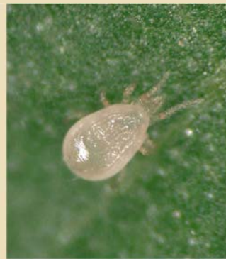
ミヤコカブリダニ