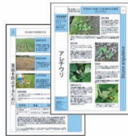
図1 警戒すべき帰化雑草としてパンフレットを作成 http://narc.naro.affrc.go.jp/chousei/shiryu/kankou/weed/sicyos.pdf

なら、アレチウリは近い将来に「第2のアサガオ」となりうるからです。問題が大きくなってから対策を立てるのは非常に困難です。ここでは、なぜアレチウリに警戒する必要がありますかを解説します(表1)。