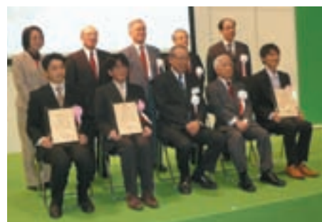
若手農林水産研究者表彰式

本研究で新しく開発した技術を他の技術と区別するため、STING法(Simultaneous reaction of Transesterification and crackING-Process)と呼称しています。