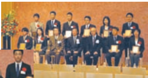
日本農学進歩賞授賞式

テル等に変換され、再度原料として利用されるか、燃料と一緒に燃焼できる成分となります。一部、未反応のグリセリンがわずかに残りますが、再度原料に戻すことで装置の外に排出されることはありません。このように分解反応を含む様々な反応が同時に進行するため、その燃料成分は300以上で構成されており、その中には通常のバイオディーゼル燃料よりも分子量の小さい成分も多く含有されています。その