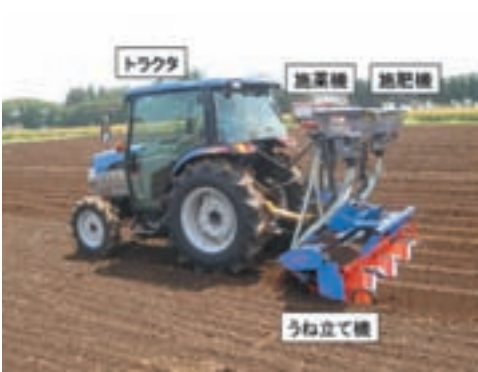
図2 うね内部分施用機

はじめに キャベツ・ハクサイなどの露地野菜作で、肥料の施用範囲を限定することができる「うね内部分施用法」とこれを実現する「うね内部分施用機」を開発しました。これにより、肥料施用量を削減し、肥料代と環境負荷を大幅に低減できます。