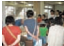
そば打ち名人による実演

北陸研究センター(新潟県上越市)では、7月11日・12日の2日間一般公開を開催しました。今回新たに行った粘土でいろいろなものを作る「土遊び」は子供たちに人気で、時間を忘れて没頭していました。また、一般向けに行った当センターで育成したそば品種「とよむすめ」の試食も、大変おもしろいと好評でした。