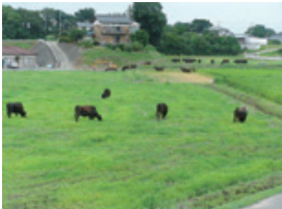
春夏期:牧草・野草放牧

そこで、関東飼料イネ研究チームでは、飼料イネ生産と放牧を組み合わせた農地管理と繁殖和牛の周年放牧モデルの開発に、茨城県常総市で畜産農家（繁殖牛70頭飼養）、耕種農家（3戸、農用地24ha管理）とともに取り組んでいます。このモデルでは、図1のように牧草や野草と飼料イネ、稲発酵粗飼料（イネWCS）を利用して、放牧可能な繁殖和牛（飼養頭数の半数にあたる妊娠確認牛）を、これら飼料の生産圃場で周年放牧します。いわば飼料の地産地消です。図2のように平成19年5月から20年4月までに延べ約1万頭・日の繁殖和牛を放牧しました。放牧飼料の内訳は、牧草・野草約4400頭・日、飼料イネ約1500頭・日、イネWCS約3700頭・日です。飼料イネの活用