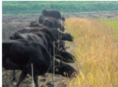
秋期:飼料イネ立毛放牧