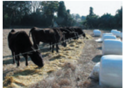
冬期:イネWCSの放牧利用