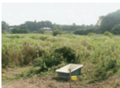
図4 放牧で未利用資源の有効活用と耕作基盤の復元が実現