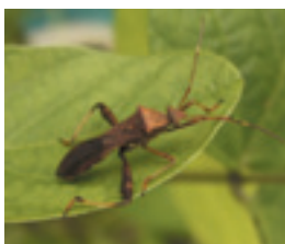
図1 ホソヘリカメムシ

昆虫のフェロモンには「性フェロモン」や「集合フェロモン」などがあります。フェロモンを作物の害虫防除に利用する試みは、主に性フェロモンで進められており、交尾を阻害したり、虫の発生時期や量を予測するのに使われています。性フェロモンはガの仲間のものがよく知られていますが、カメムシ類でも幾つかの種でフェロモンがあることが知られています。このうち、ダイズ等の重要害虫であるホソヘリカメムシ(図1)では、オス成虫がフェロモンで仲間やメス成虫を誘引します。しかし、オスのカメムシが出すフェロモンがどのよう