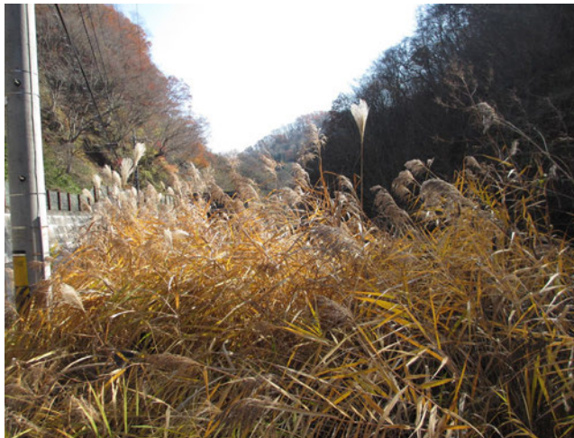
Photo 3. M. sacchariflorus collected in Nagano city, Nagano (Col. No. C8, Kinasa, altitude 793 m).

写真2. 新潟県十日町市で収集したオギ (収集番号 C15, 清津川, 標高 315 m)