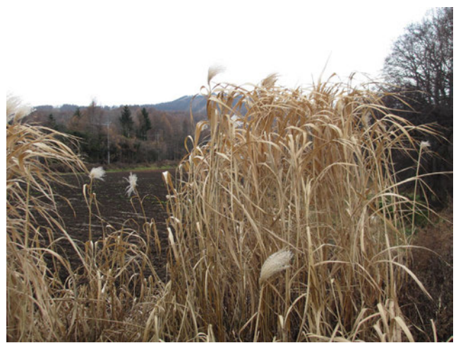
Photo 4. M. sacchariflorus collected in Ueda city, Nagano (Col. No. C13, Sugadaira, altitude 1264 m).

写真3. 長野県長野市で収集したオギ (収集番号 C8, 鬼無里, 標高 793 m)