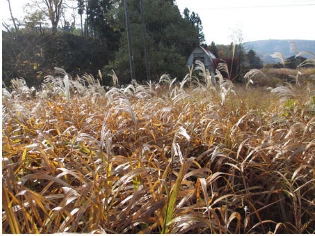
Photo 1. M. sacchariflorus collected in Myoukou city, Niigata (Col. No. C7, Sekikawa, altitude 503 m).

写真1. 新潟県妙高市で収集したオギ (収集番号 C7, 関川, 標高 503 m)