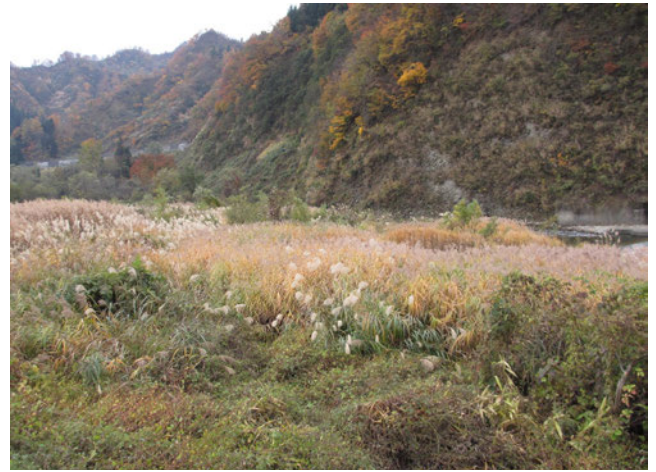
Photo 2. M. sacchariflorus collected in Tookamachi city, Niigata (Col. No. C15, Kiyotsugawa, altitude 315 m).

写真1. 新潟県妙高市で収集したオギ (収集番号 C7, 関川, 標高 503 m)