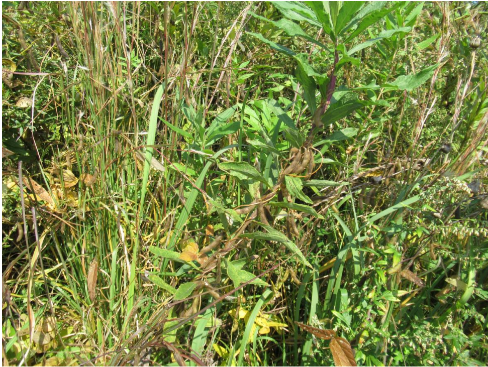
Photo 1. A wild soybean accession (JP269351) collected from along the Yoshii River.

写真 1. 吉井川流域で収集したツルマメ (JP269351: COL/ 岡山 /2018/ 西日本農研 /GS12).