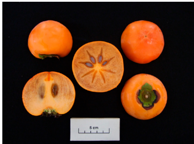
Fig. 3 Seeded fruit of 'Reigyoku'