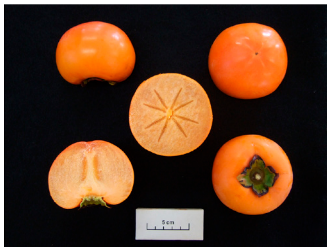
Fig. 4 Seedless fruit of 'Reigyoku' without pollination.