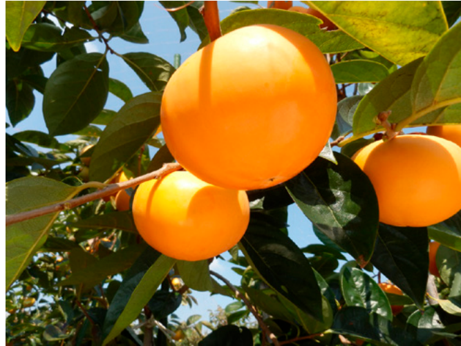
Fig. 2 Fruit of 'Reigyoku' on tree.