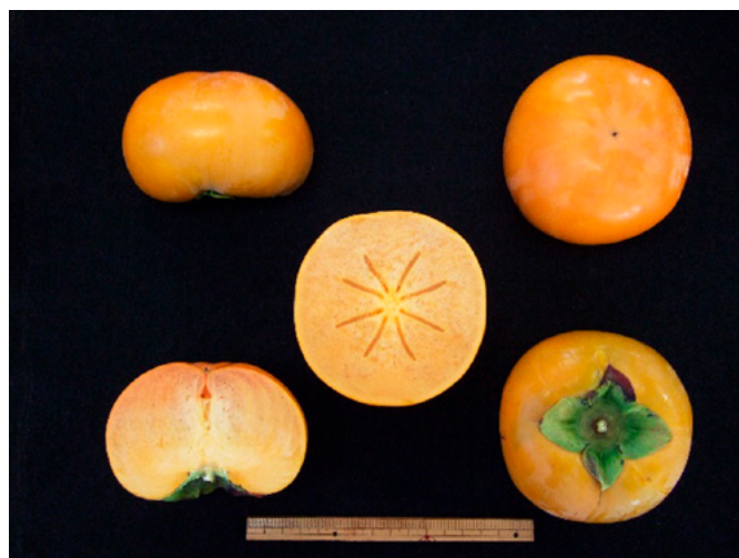
Fig. 4 Seedless fruit of 'Taiga' without pollination.