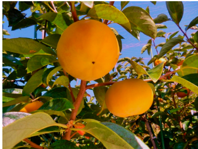
Fig. 2 Fruit of 'Taiga' on tree.