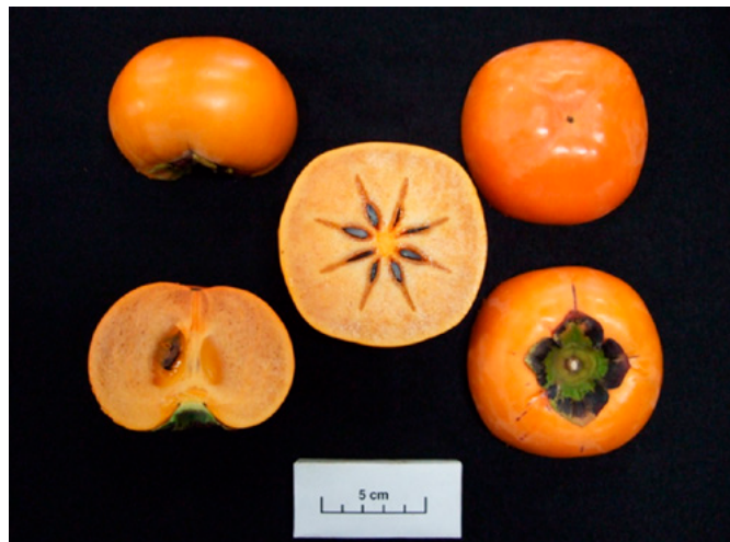
Fig. 3 Seeded fruit of 'Taiga'