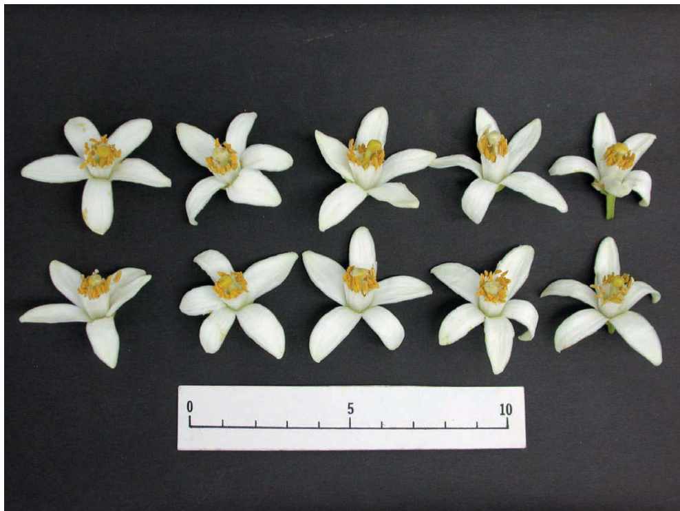
Fig.1 Flower of 'Kankitsu Kuchinotsu 41 Gou'