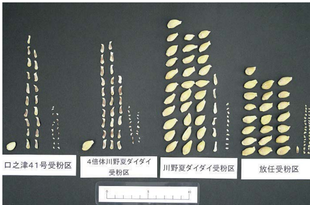
Fig.4 Seed number of Hyuga-natsu pollinated with 'Kankitsu Kuchinotsu 41 Gou', 4x 'Kawano natsudaikai', 'Kawano natsudaikai', and open pollination (from left to right)